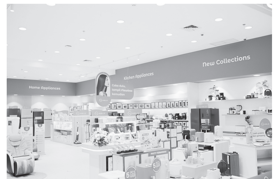
Toko KELS di Living World Kota Wisata Cibubur.

Kemudahan bertransaksi juga dapat dinikmati melalui fasilitas cicilan 0% hingga 24 bulan menggunakan kartu kredit bank partner, atau cicilan tanpa kartu kredit melalui Danakini yaitu lembaga pembiayaan yang merupakan bagian dari Kawan Lama Group. ● vit